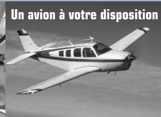
Un avion à votre disposition