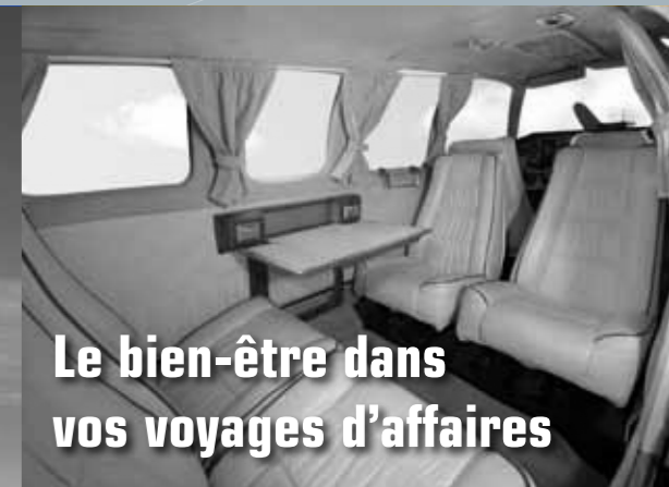
Le bien-être dans vos voyages d'affaires