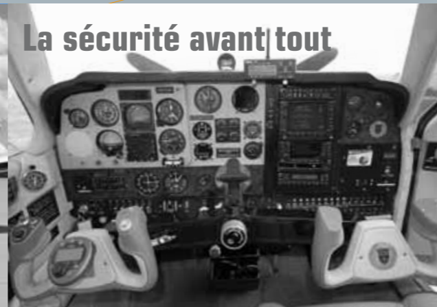
La sécurité avant tout