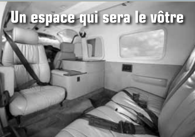
Un espace qui sera le vôtre