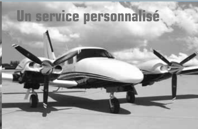
Un service personnalisé